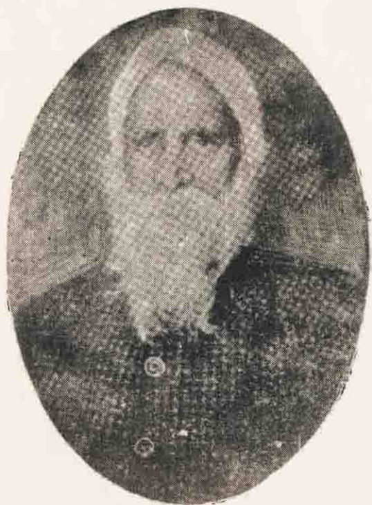
ਸਾਹਿੱਤ-ਆਚਾਰੀਆ ਪੰਡਿਤ ਕਰਤਾਰ ਸਿੰਘ 'ਦਾਖਾ' (13 ਸਤੰਬਰ, 1888 — 25 ਨਵੰਬਰ, 1958)